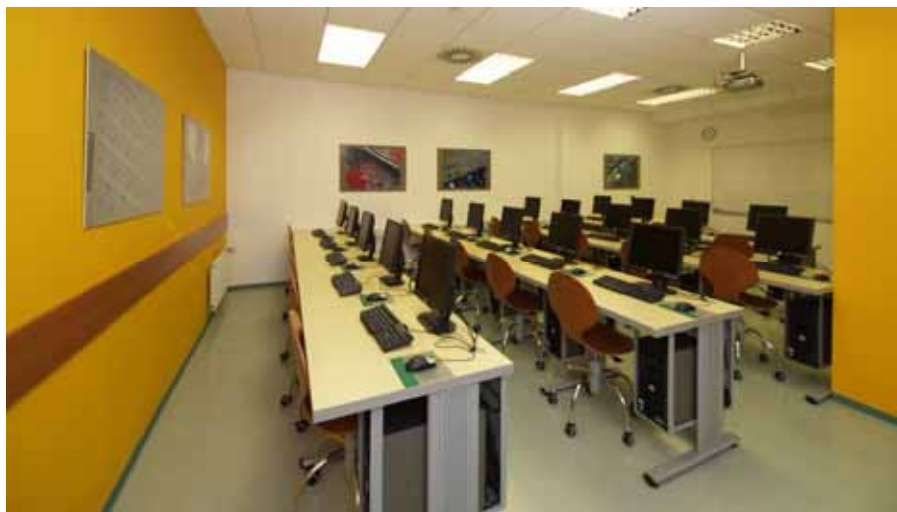
Računalniška predavalnica v Ljubljani

Individualno študijsko delo študenta zajema sprotno delo, izdelavo seminarских nalog, poročil, dnevnikov, študij literature, pripravo na izpite ter izdelavo in zagovor diplomske naloge.