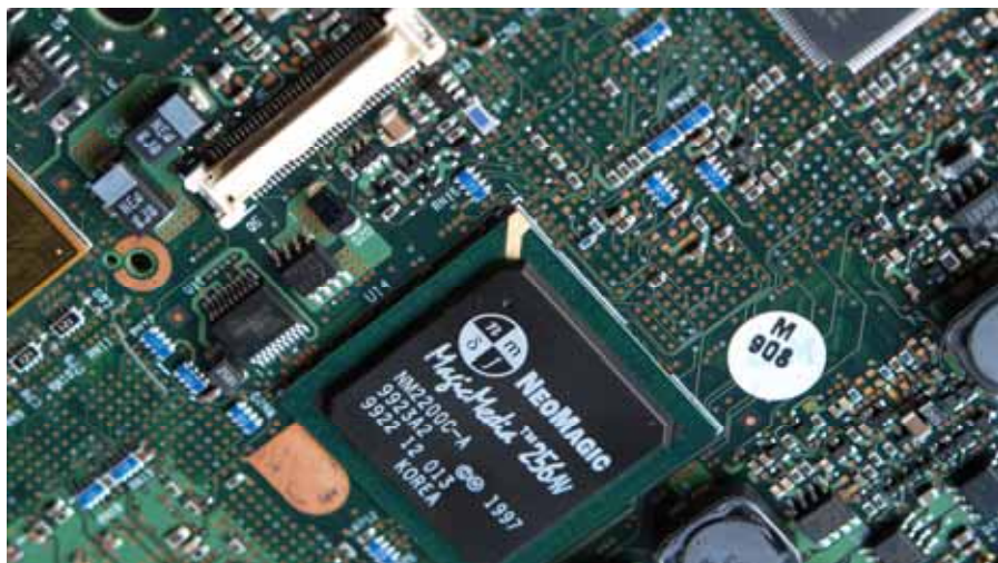
Matična plošča