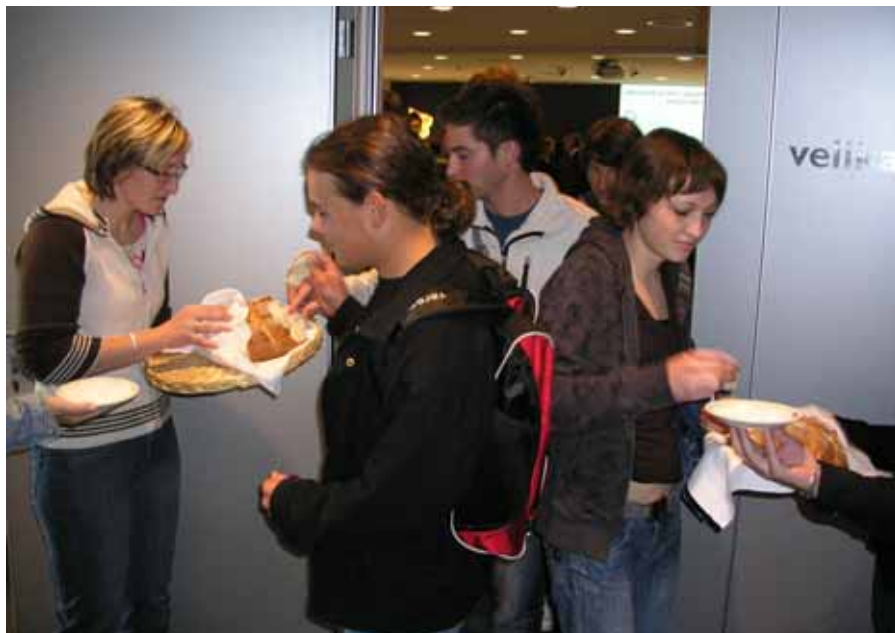
Prvi dan študija sprejmemo bruce s kruhom in soljo

Ob zaključku študija dobi študent diplomo, ki je javna listina ter prilogo k diplomu.